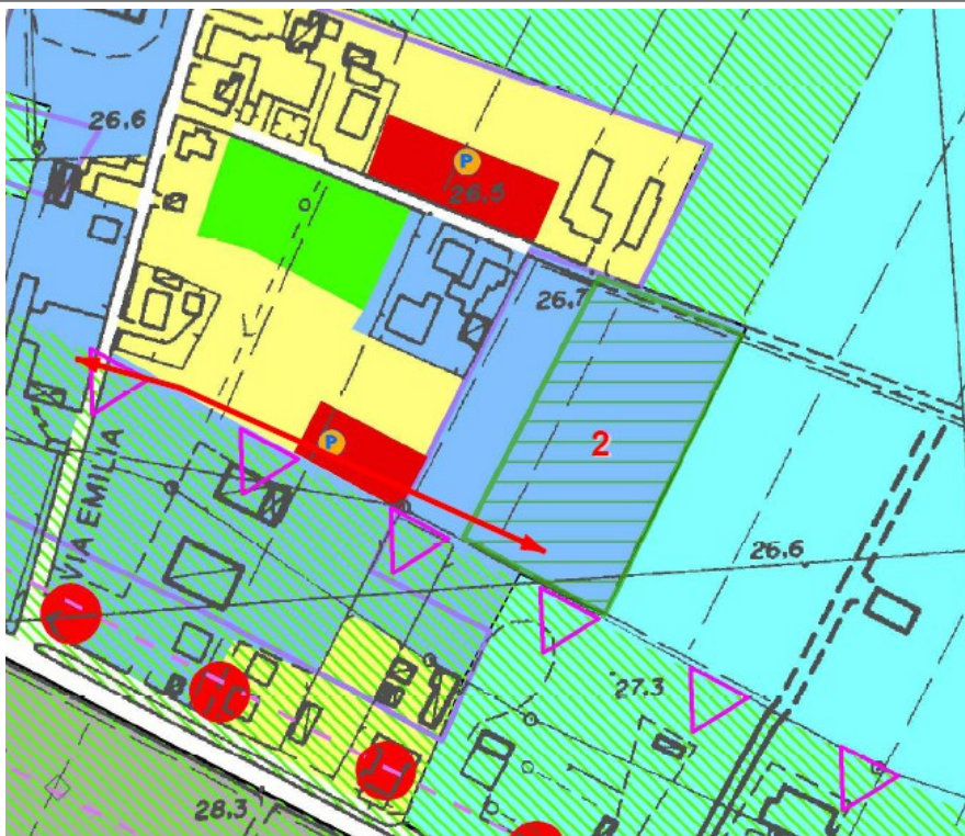
SU BASE PSC ( approvato con Atto C.C. N. 74 Del 31/07/2006)