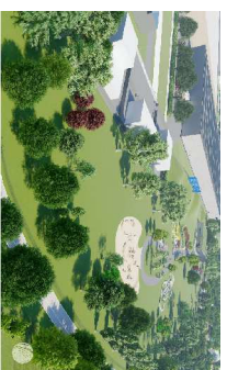
Via area parco tematico