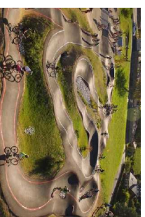
playa tipo pump track sistema