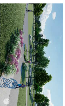
Via parco tematico, class 7/14 anni