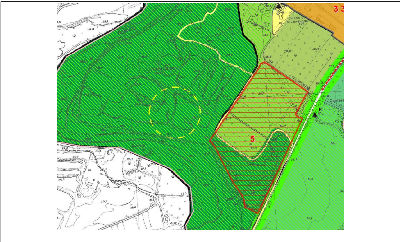
SU BASE PSC ( approvato con Atto C.C. N. 74 Del 31/07/2006)