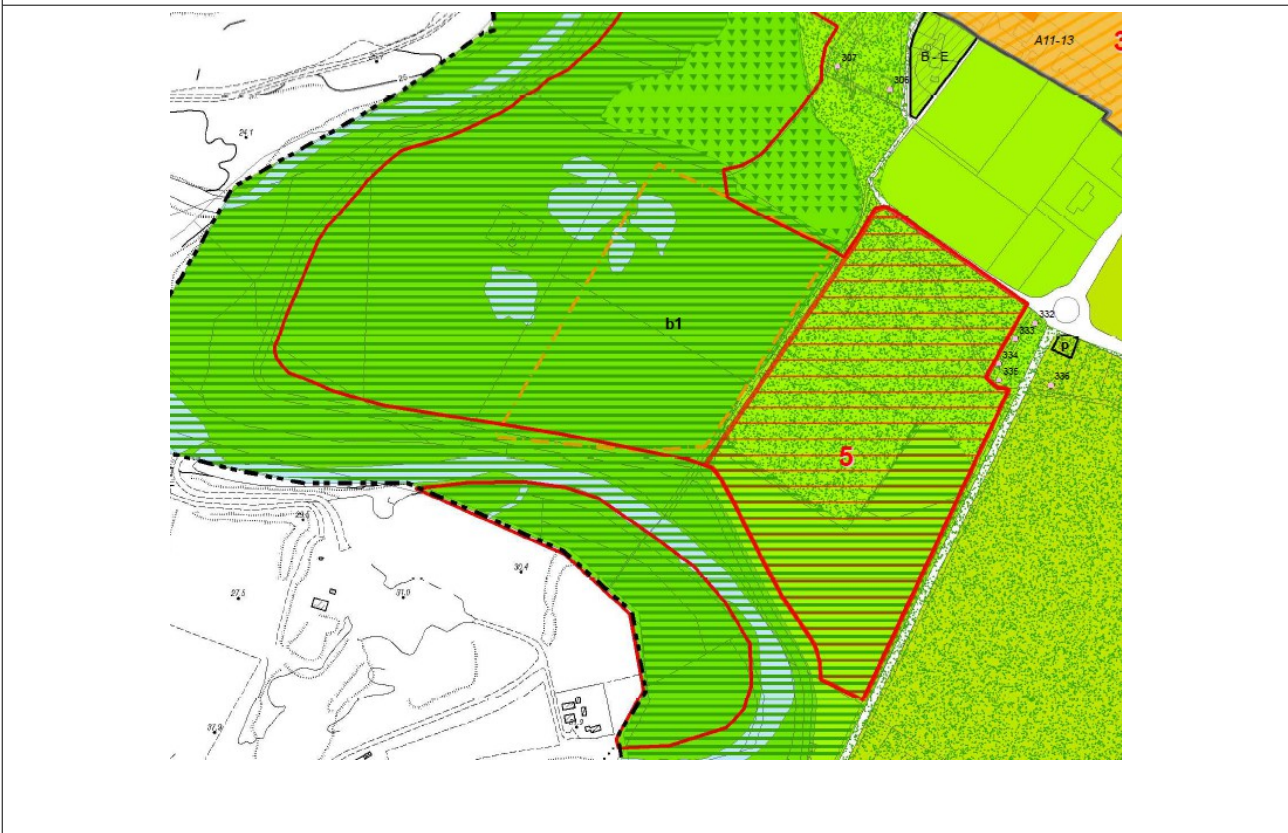
SU BASE 3 VAR RUE ( approvata con atto C.C. n. 45 del 20/09/2017)