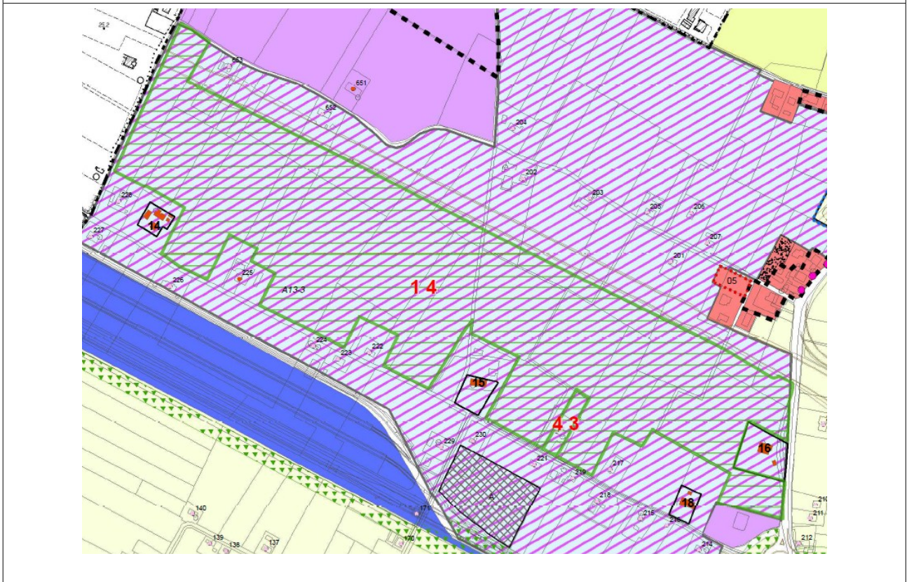
SU BASE 3 VAR RUE ( approvata con atto C.C. n. 45 del 20/09/2017)